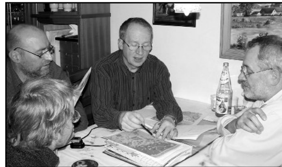
Für seine Aktivitäten zur touristischen Verbesserung der Radrouten, die an den Harzrundweg grenzen, bekam der ADFC Nordhausen 2002 einen Preis zum Umweltfest des Landkreises Nordhausen