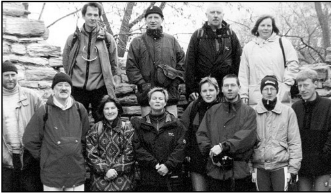
Radtouren von Donndorf entlang der Unstrut - z.B. zum Wendelstein und der Klosterruine Memleben - waren interessante und erlebnisreiche Unternehmungen (Foto 2001)