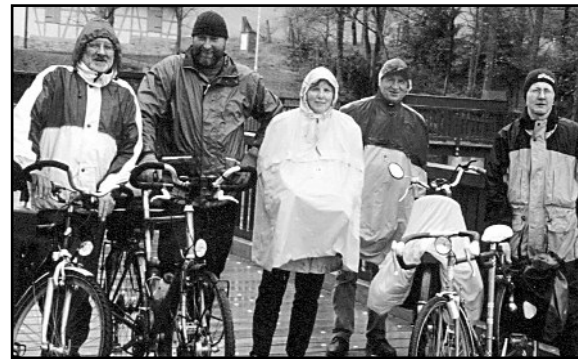
Auch wenn sie in den Radkalendern des Pedalritters nicht auftauchten, gab es schöne Radtouren des Kreisverbandes für alle Interessierten, selbst bei schlechtem Wetter